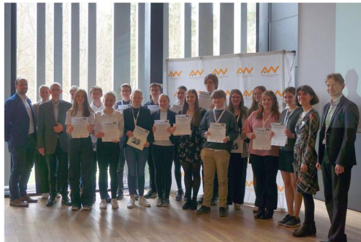
Teilnehmende Schülerinnen und Schüler sowie Organisatoren des Ostbayerischen ScienceCamps.

Getreu dem Motto stand ganz viel ausprobieren und selber machen auf dem Programm, zum Beispiel das Sezieren von Schweineherzen. Dabei lernten die Schülerinnen und Schüler den Aufbau des Herzens, aber auch die Funktionsweise und Parallelen zum menschlichen Herzen kennen. Vertieft wurden diese grundlegenden Kenntnisse zur Herzphysiologie am zweiten Tag. Hier lernten sie, wie EKG-Ableitungen nach Einthoven durchzuführen sind oder welchen Einfluss Schmerz auf den menschlichen Blutdruck hat – und das nicht nur in der Theorie, sondern am eigenen Körper. Beim Cold-Pressure-Test wird dafür eine Hand in Eiswasser getaucht, während der Blutdruck gemessen wird.